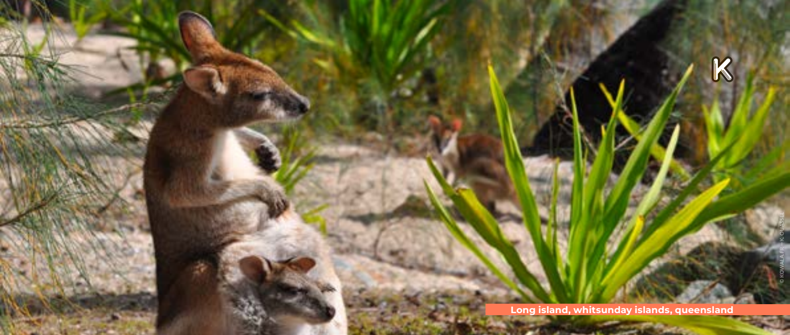
Long island, whitsunday islands, queensland